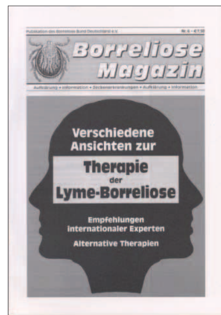
Borreliose Magazin Nr. 6/2002