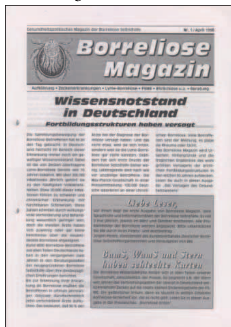
Borreliose Magazin Nr. 1/1998

1999 43 Mitglieder. MV in Hamburg: 9 Teilnehmer. Sie beschließen die Mitgliedschaft im Paritätischen Hamburg. Weitere (außerordentliche) MV in Fulda, 30 Teilnehmer. Umbenennung des Lyme-Borreliose-Bundes in Borreliose Bund Deutschland e.V., Bundesverband der Borreliose-Selbsthilfe. Das Borreliose Magazin wird als offizielles