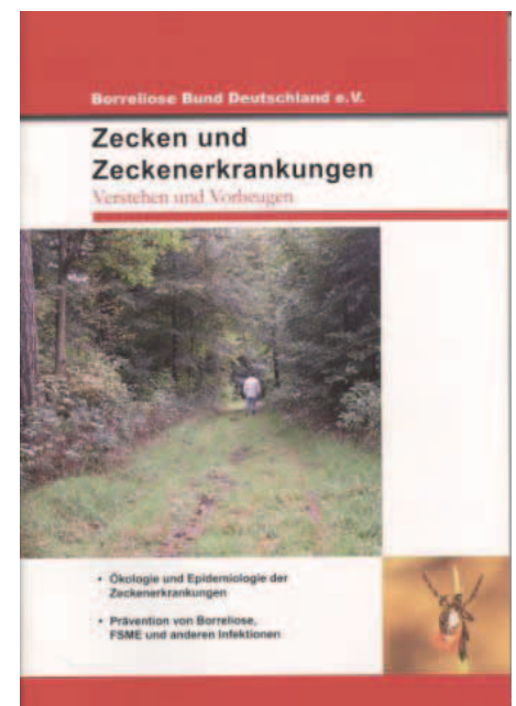
Broschüre: Zecken und Zeckenerkrankungen

Mergentheim. Workshop „Öffentlichkeitsarbeit für Selbsthilfegruppen“. Ausweitung der Telefonberatung an vier Tagen. Ab sofort dürfen mehrere Vorstandsmitglieder nicht mehr aus der gleichen Familie oder Partnerschaft kommen. Die Alleinvertretungsmacht des Vorsitzenden wird aufgehoben. Einführung eines Logos. Ab Februar wird das Borreliose Magazin umbenannt in BORRELIOSE WISSEN (BW) . Einladung von der Patientenbeauftragten der Bundesregierung in den Berliner Reichstag (Deutscher Bundestag).