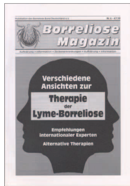
Borreliose Magazin Nr. 6/2002