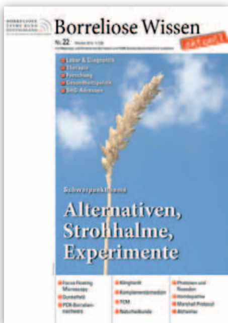
Borreliose Wissen Nr. 22/2010 „Alternativen“