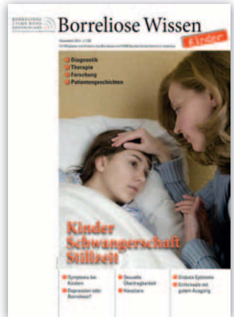
Borreliose Wissen KINDER/ 2012

2009 1.013 Mitglieder. MV in BSS. 47 Teilnehmer/90 Stimmen. Vorstandswahl. Beschlossen werden die erste Beitrags- und Kostenordnung, Vereinsgrundsätze, die ermäßigte Partnermitgliedschaft sowie eine