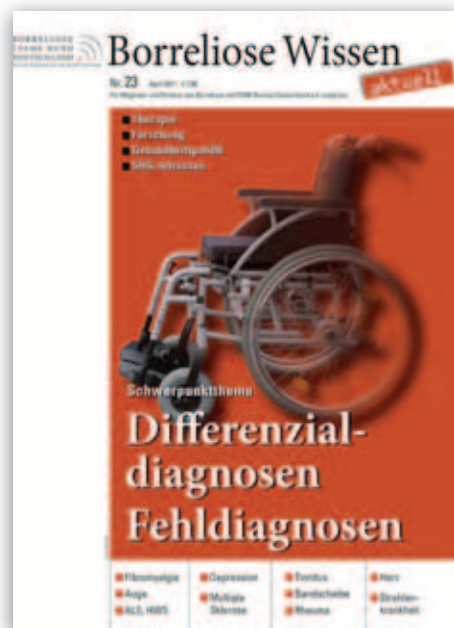
Borreliose Wissen Nr. 23/2011 „Fehldiagnosen“

briefe an Politiker aller Bundesländer. Vorstand reist ins Saarland und nach Rheinland-Pfalz und erreicht die Meldepflicht in beiden Bundesländern. Erneut 40.000 Kinderhefte verbreitet. Politische Reisen nach