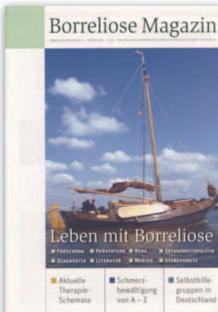
Borreliose Magazin 11/2005 „Leben mit Borreliose“