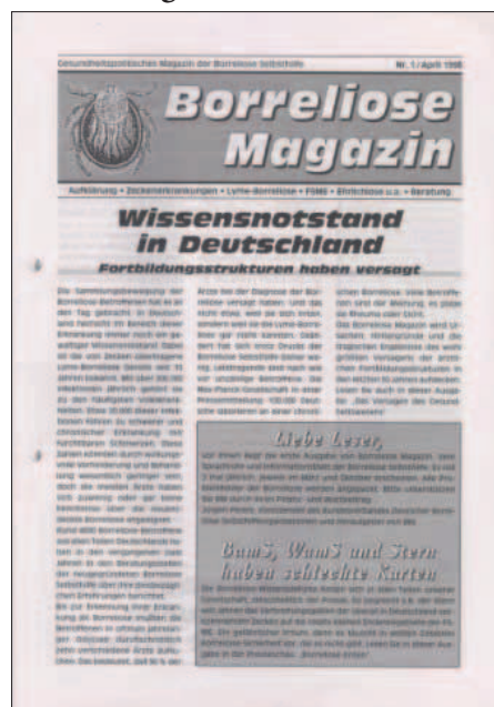
Borreliose Magazin Nr. 1/1998

1999 43 Mitglieder. MV in Hamburg: 9 Teilnehmer. Sie beschließen die Mitgliedschaft im Paritätischen Hamburg. Weitere (außerordentliche) MV in Fulda, 30 Teilnehmer. Umbenennung des Lyme-Borreliose-Bundes in Borreliose Bund Deutschland e.V., Bundesverband der Borreliose-Selbsthilfe. Das Borreliose Magazin wird als offizielles