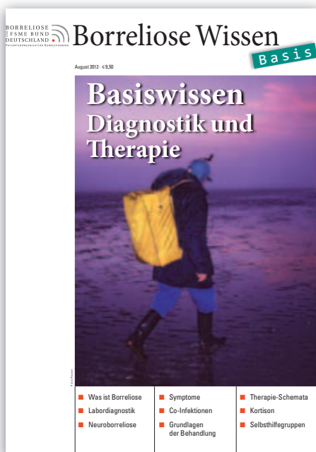
Borreliose Wissen BASIS 2008/11/12