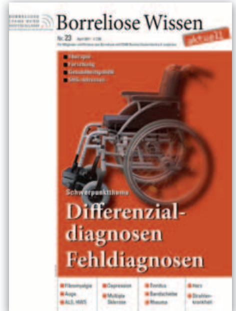
Borreliose Wissen Nr. 23/2011 „Fehldiagnosen“

briefe an Politiker aller Bundesländer. Vorstand reist ins Saarland und nach Rheinland-Pfalz und erreicht die Meldepflicht in beiden Bundesländern. Erneut 40.000 Kinderhefte verbreitet. Politische Reisen nach