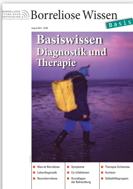
Borreliose Wissen BASIS 2008/11/12

2008 850 Mitglieder. MV in Bad Soden-Salmünster (BSS). 77 Teilnehmer. MV beschließt Möglichkeit der Stimmübertragung. Referenten: