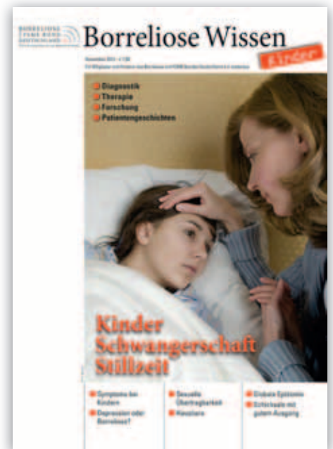
Borreliose Wissen KINDER/2012

2009 1.013 Mitglieder. MV in BSS. 47 Teilnehmer/90 Stimmen. Vorstandswahl. Beschlossen werden die erste Beitrags- und Kostenordnung, Vereinsgrundsätze, die ermäßigte Partnermitgliedschaft sowie eine